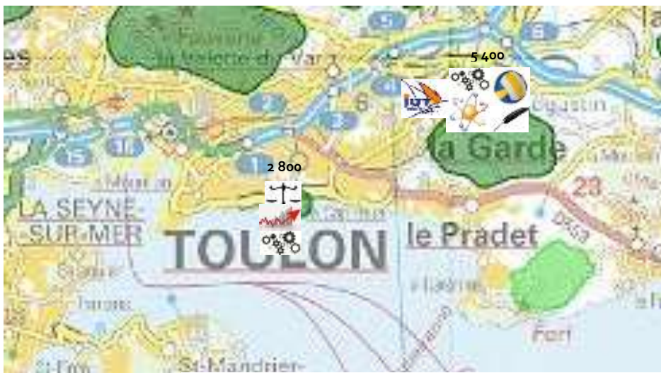
Localisation des principaux effectifs universitaires Var

Ainsi la cafétéria du Beal à La Garde située au cœur du campus se verra adjoindre un animateur pour développer les manifestations en journée et le soir, une permanence du BAPU sera créée en septembre 2015. Le jardin culturel Portalis qui ouvrira le 1 er septembre 2015 sera l'amorce du développement d'une vie culturelle plus riche.